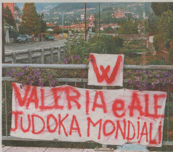
Uno striscione per i due atleti a Negrar